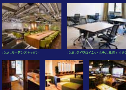
12-A: ガーデンズキッチン 12-B: ダイワロイネットホテル札幌すすきの 12-C: Apple Lodge 12-D: CO,LA,BO 12-E: e-REVO

北海道発!街の空間と働く人をつなぐ、空間予約アプリが登場。ホテルやラウンジなど「集中しながらも安心できる空間」を提供します。登録店舗拡大中!