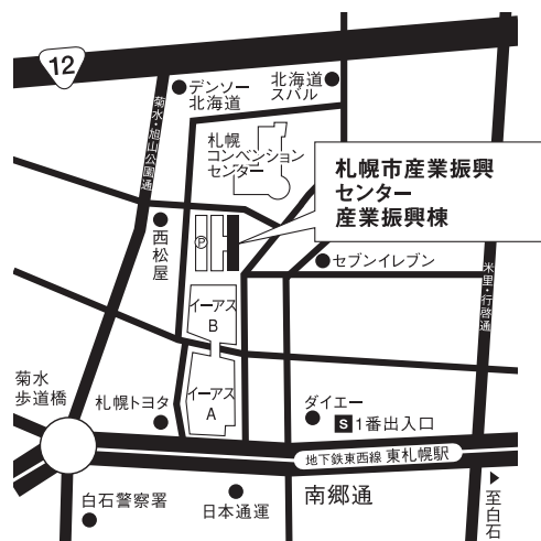
セミナー会場 札幌市産業振興センター2階